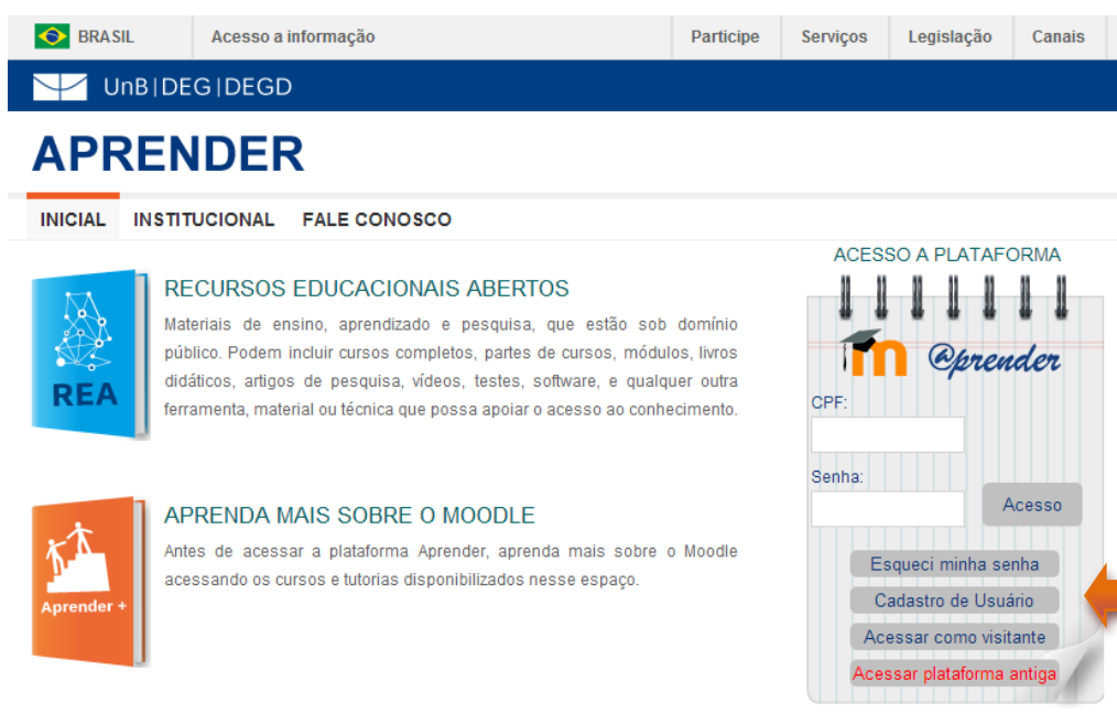
Figura 1 - Localização do botão Cadastro de usuário.

Você será redirecionado para a página de Cadastramento de novo usuário (figura 2). A seguir, detalharemos cada uma das áreas deste formulário com seus respectivos campos.