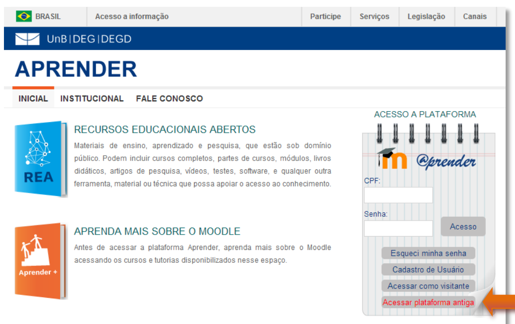
Figura 1 - Localização do botão Acessar plataforma antiga.

Após clicar no botão Acessar plataforma antiga, nova página será aberta com a página para acesso à plataforma Aprender UnB, versão 1.9.